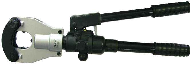
„HD400-6“ Art. 216661